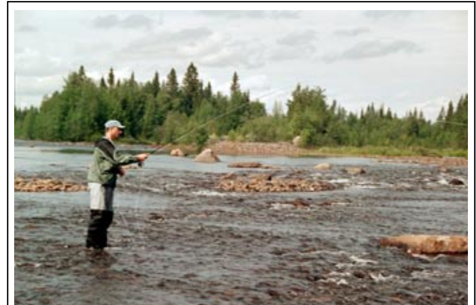
Artikelförfattaren i full aktion

tryckte på botten vid de stora selen. Framåt ett på natten hade ingen av oss fått någon fisk att tala om. Vi begav oss hemåt lägret för en god natts